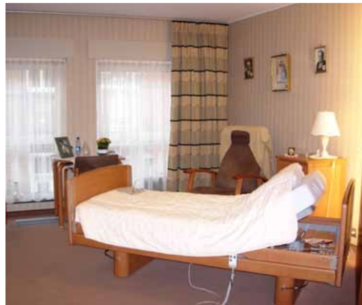
De nieuwe generatie senioren wil meer comfort en privacy. (foto KM)

Seniorenconsulent Herman Plasmans. (foto KM)