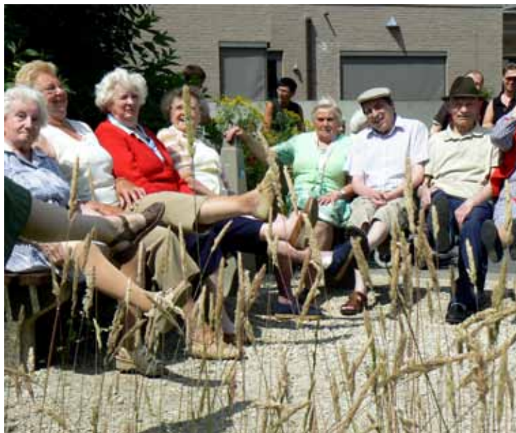
Zelfredzaamheid en geestelijke helderheid bepalen mee opnameprioriteit.

Een andere mogelijke oplossing is een inschrijving bij het Vlaams Agentschap Voor Personen met een Handicap (VAPH). "Die organisatie veranderde al enkele keren van naam. Het huidige webadres is www.vaph.be . Je moet je inschrijven voor je 65ste verjaardag en een al dan niet toekomstige mate van hulpbehoefte kunnen aantonen. Het VAPH bezorgt je dan een lijst van de zogenaamde tehuizen voor niet-werkenden in je regio, waarmee