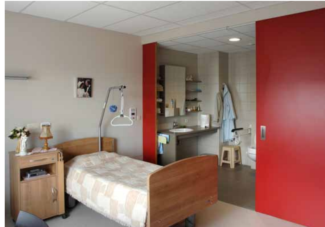
Op tijd inschrijven is de boodschap.