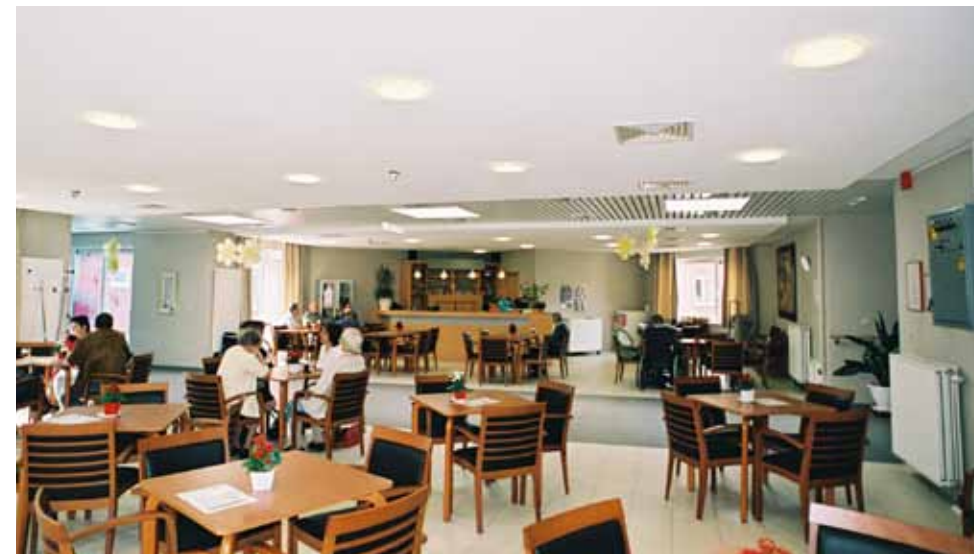
OCMW-steun kan doorslaggevend zijn.

Ik ben ervan overtuigd dat je als senior best persoonlijk en heel bewust tot beslissingen kunt komen om kleiner te wonen. Als je nog voor jezelf kunt zorgen en gesteld bent op je zelfstandigheid, dan adviseer ik om je een serviceflat te nestelen. Je zult dan afstand moeten doen van een aantal voorwerpen én van je vertrouwde omgeving. Maar je verhuist wel naar een appartement mét service. Al klant vaak daar het schoentje."